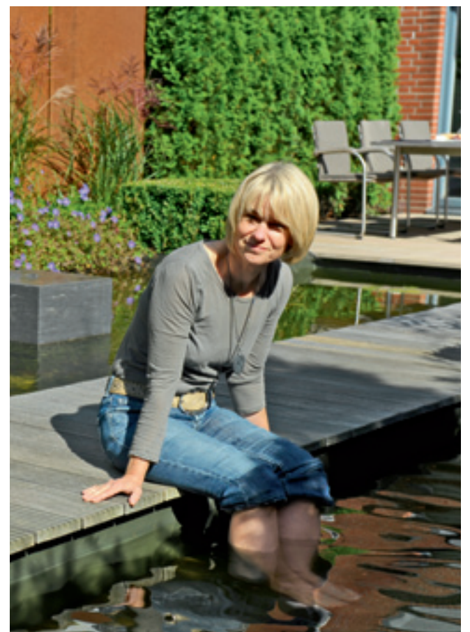
Mein Garten ist mein Zuhause.

gerade Linien und reduzierte Formen?“ Designfreunde und Ästheten verbindet die Liebe zu klaren Formen, doch während der Designfreund extrovertiert ist, sucht der Ästhet einen Rückzugsraum. Naturfreund und Genießer bevorzugen organische Formen. Nach der Orientierung mit Hilfe der Gartentypen folgt die thematische Ausgestaltung. So kann ein Garten für Ästheten als englischer Heckengarten oder als japanischer Teegarten gestaltet werden. Haben Sie Ihren Gartentyp schon gefunden? Wenn nicht – auf unserer Homepage finden Sie unseren Gartentypentest. Gerne beraten wir Sie auch persönlich.